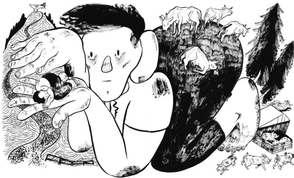
Zeichnung aus «Starkes Ding»